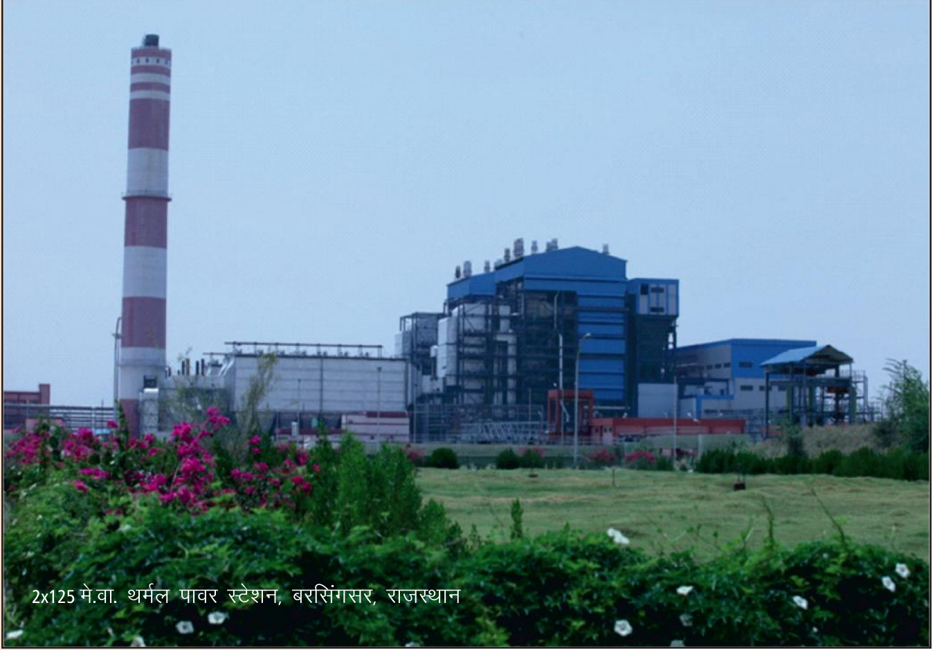
2x125 मे.वा. थर्मल पावर स्टेशन, बरसिंगसर, राजस्थान