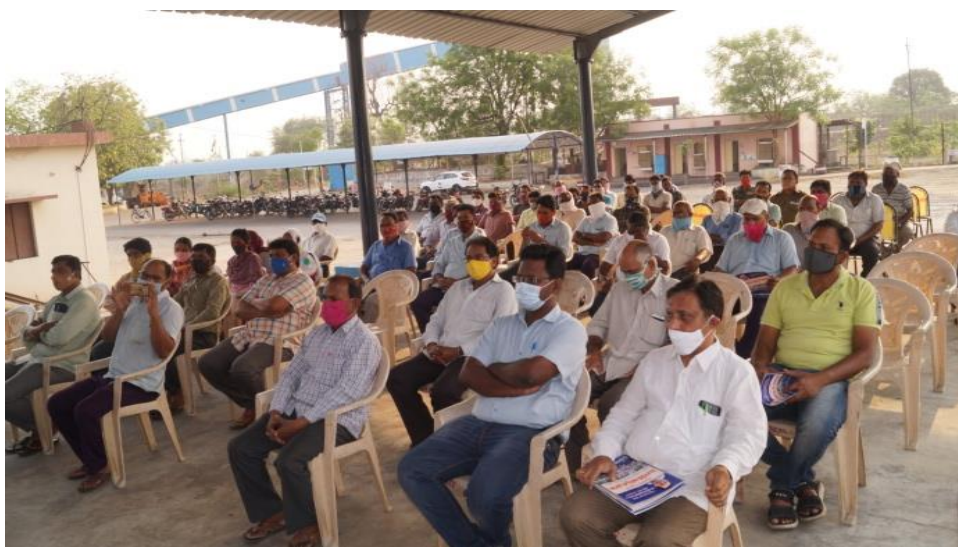
Conducting talks on "Measures to prevent Corruption in SCCL" at Bellampalli Area