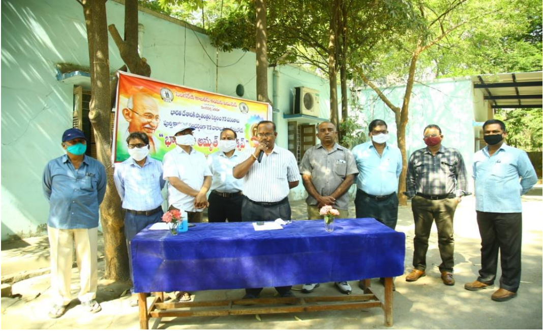
General Manager, Mandamarri Area addressing the employees of GM's Office in awareness programme on anti corruption