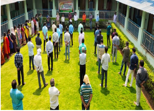
Taking Oath on curbing corruption by staff and employees of at GM office, Bhupalapalli on 10.04.2021 in 4 th week celebrations of " Bharat Ka Amrut Mahotsav"