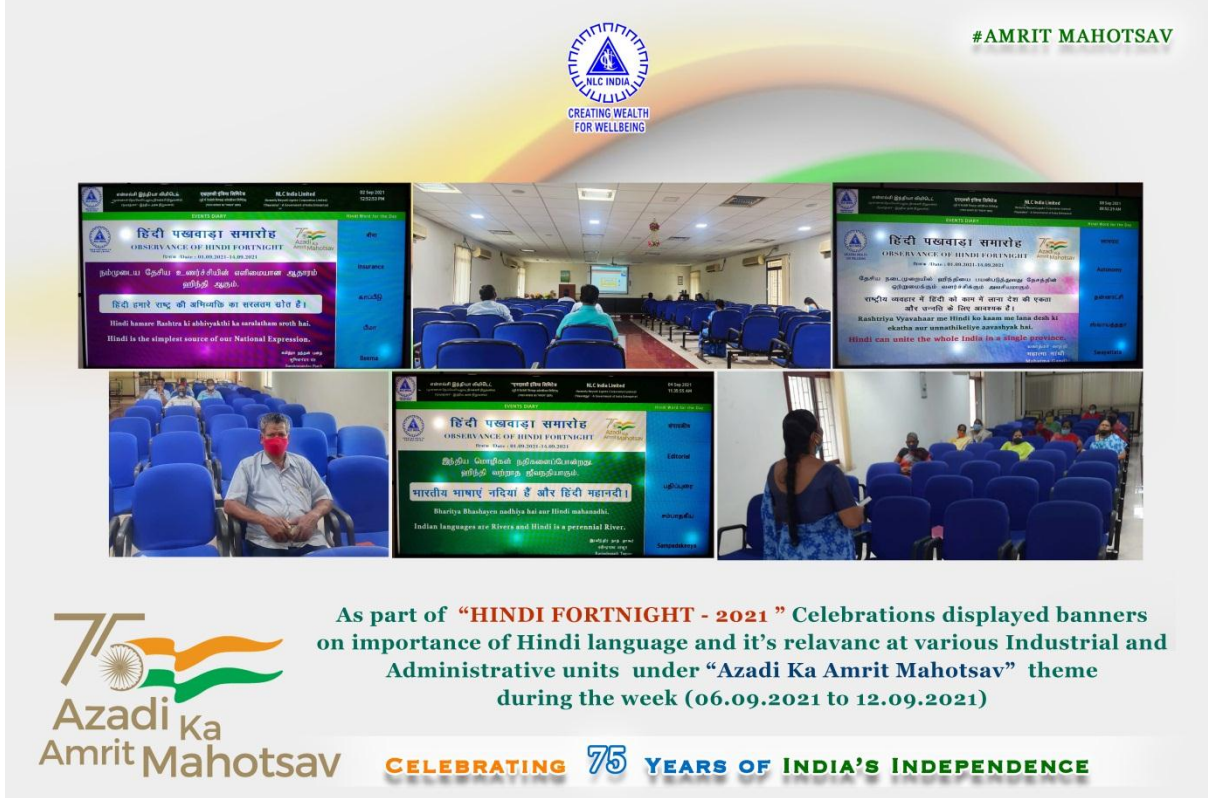
As part of “HINDI FORTNIGHT - 2021 ” Celebrations displayed banners on importance of Hindi language and it’s relavanc at various Industrial and Administrative units under “Azadi Ka Amrit Mahotsav” theme during the week (06.09.2021 to 12.09.2021)

“HINDI FORTNIGHT - 2021 ” Celebrations under “Azadi Ka Amrit Mahotsav” theme for creating awareness as advised by Ministry of Home Affairs, Govt. of India by following the preventive measures as maintaining social distancing, wearing of Mask etc.