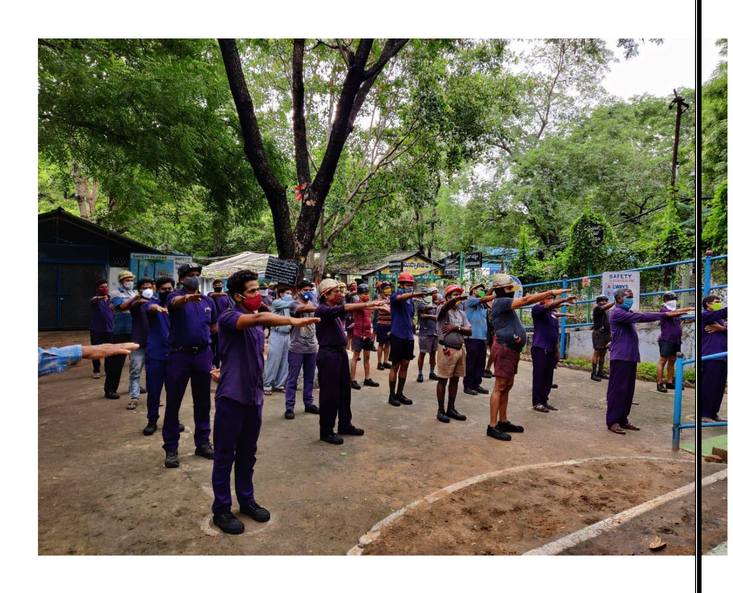
Pledge in a mine