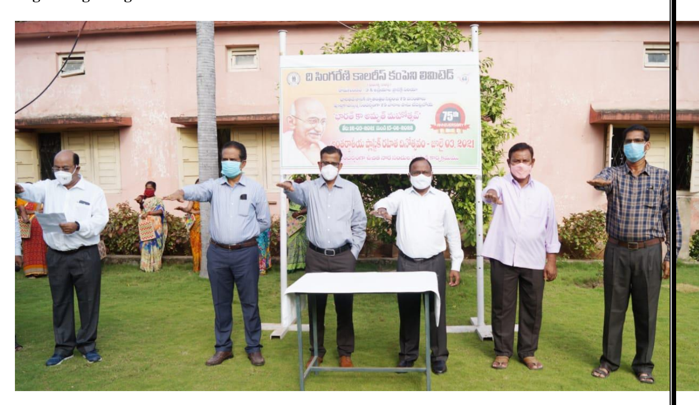
RG-3 Area & APA