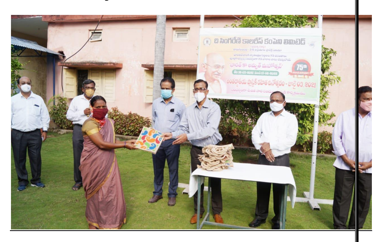
RG-3 Area & APA